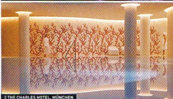
3 THE CHARLES HOTEL, MÜNCHEN