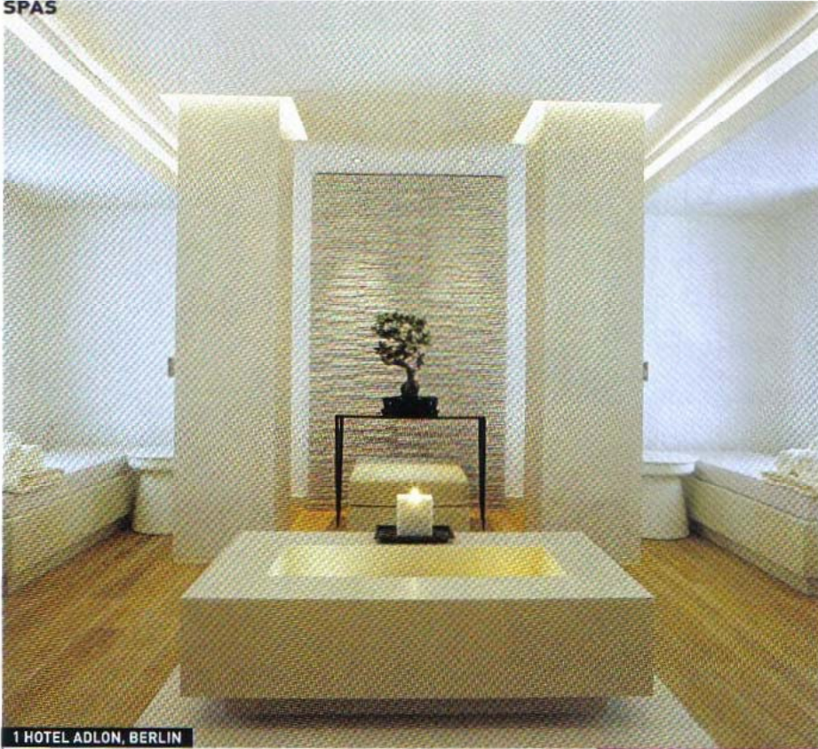
1 HOTEL ADLON, BERLIN