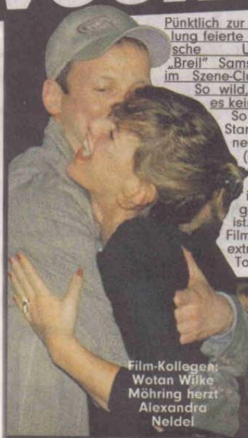
Film-Kollegen Wotan Wilke Möhring herzt Alexandra Neldel

Pünktlich zur Zeitumstellung feierte die italienische Uhrenmarke „Breil“ Samstag nacht im Szene-Club „Felix“ So wild, als gäbe es kein Morgen... So zeigte Stargast Ornella Muti (51), daß die Zeit spurlos an ihr vorbeigegangen ist. Italiens Filmstar kam extra mit Tochter Nai-